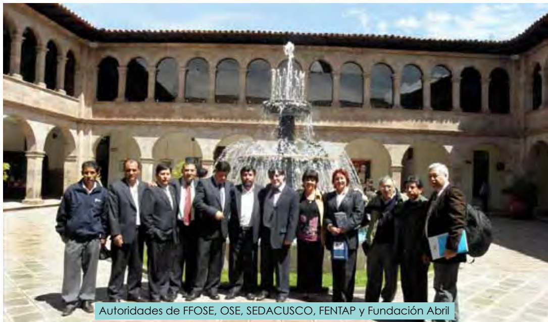
Autoridades de FFOSE, OSE, SEDACUSCO, FENTAP y Fundación Abril