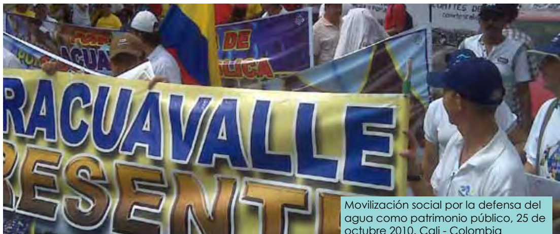
Mobilización social por la defensa del agua como patrimonio público, 25 de octubre 2010. Cali - Colombia

profundos. Así mismo, producto de este asocio público, fue la inyección de capital dirigido a lograr el saneamiento del pasivo pensional, normalización que a futuro liberaría parte de los recursos producidos por la operación para incrementar el nivel anual de las inversiones requeridas en los sistemas, y así solucionar las necesidades de las comunidades.