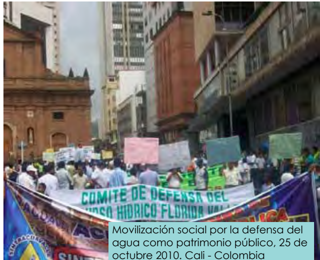
Movilización social por la defensa del agua como patrimonio público, 25 de octubre 2010. Cali - Colombia

Como parte de su estrategia de lucha SINTRACUAVALLE