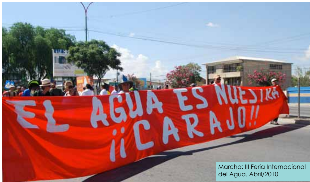
Marcha: III Feria Internacional del Agua. Abril/2010

Esperamos que nuestro primer boletín sirva para difundir el trabajo de la Plataforma sus objetivos y principios y la importancia de los acuerdos públicos comunitarios en el contexto de la defensa global del agua entendida como un bien común y un derecho humano.