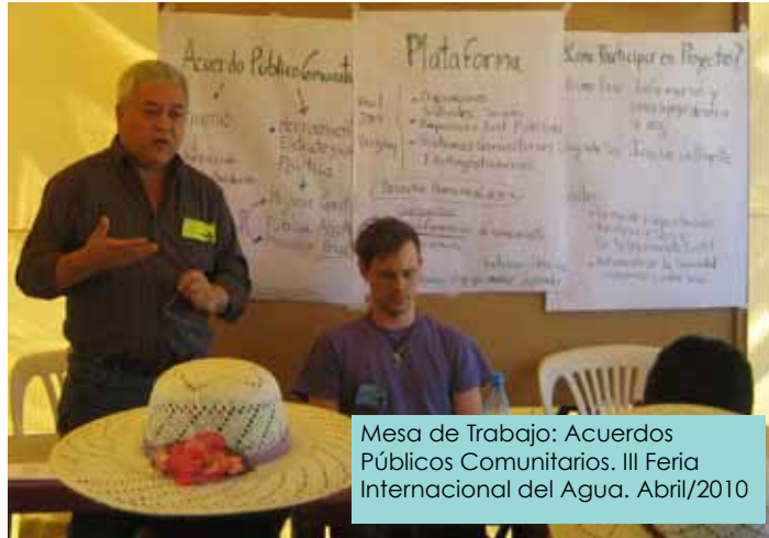
Mesa de Trabajo: Acuerdos Públicos Comunitarios. III Feria Internacional del Agua. Abril/2010

Los valores y principios que inspiran a la Plataforma establecen un marco general que guía el tipo de acuerdo que se apoyará y gestionará desde esta instancia. En este sentido, y puesto que los acuerdos tienen como finalidad mejorar la integralidad del