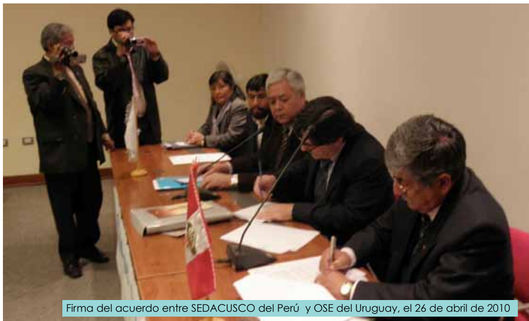
Firma del acuerdo entre SEDACUSCO del Perú y OSE del Uruguay, el 26 de abril de 2010

cooperación, y donde sea necesario, la intervención crítica a nivel global y regional con los (pocos) espacios de apertura política que se presentan, como por ejemplo es el caso de Global Water Operators Partnership Alliance GWOPA.